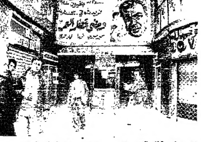
ومشى قطار العمر